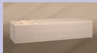
桐張棺 ※表面は桐経木張