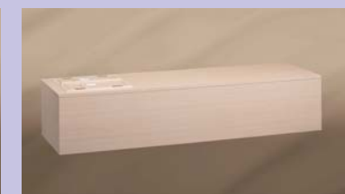
プリント棺 ※表面は紙木目柄