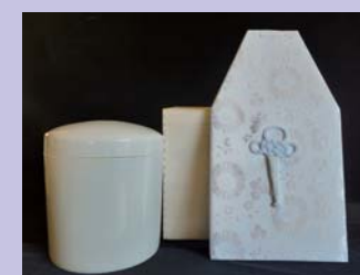
遺骨収納容器 (白瀬戸)